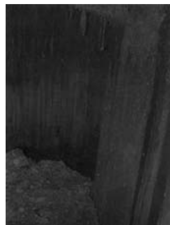
Chemins dans la caillasse d'ombres , 2009, 8 dessins à la mine de plomb, 40 x 60 cm.