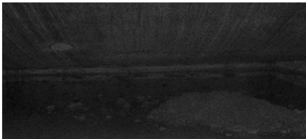
Chemins dans la caillasse d'ombres , 2009, 8 dessins à la mine de plomb, 9 x 19 cm.

Si le dessin est au cœur de la pratique de Dove Allouche, il est souvent lié à d'autres médiums, comme la photographie, et se révèle source de nombreuses expérimentations. Peu d'étudiants ont mené un tel projet durant leur formation aux Beaux-Arts, mais Dove Allouche conçoit déjà à l'époque une série qui lui prend l'ensemble de ses cinq années de cursus. Une seule photographie donne lieu à deux cent quarante carnets de croquis. Le ton est donné, et chacun de ces projets sera le fruit d'une longue investigation. Pour sa série Mélanophila , réalisée de 2003 à 2008, il part de cent quarante clichés pris après un incendie qui ravagea le sud du Portugal. La totalité de ses photographies, avec la volonté de ne pas faire de choix, servit de supports à la réalisation du même nombre de dessins. Le sujet, presque identique d'un paysage et d'un sujet disparu, est répété cent quarante fois... Pour les Surplombs , le travail extrêmement minutieux exécuté à la mine de plomb accompagne